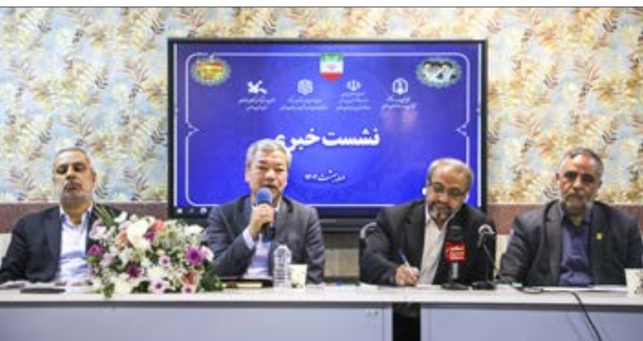
کنش‌های مسئولان آموزش و پرورش استان

طبق اعلام مسئولان آموزش و پرورش استان، هم‌زمان با این استخدام، ۷ هزار نفر از معلمان استان بازنشسته می‌شوند