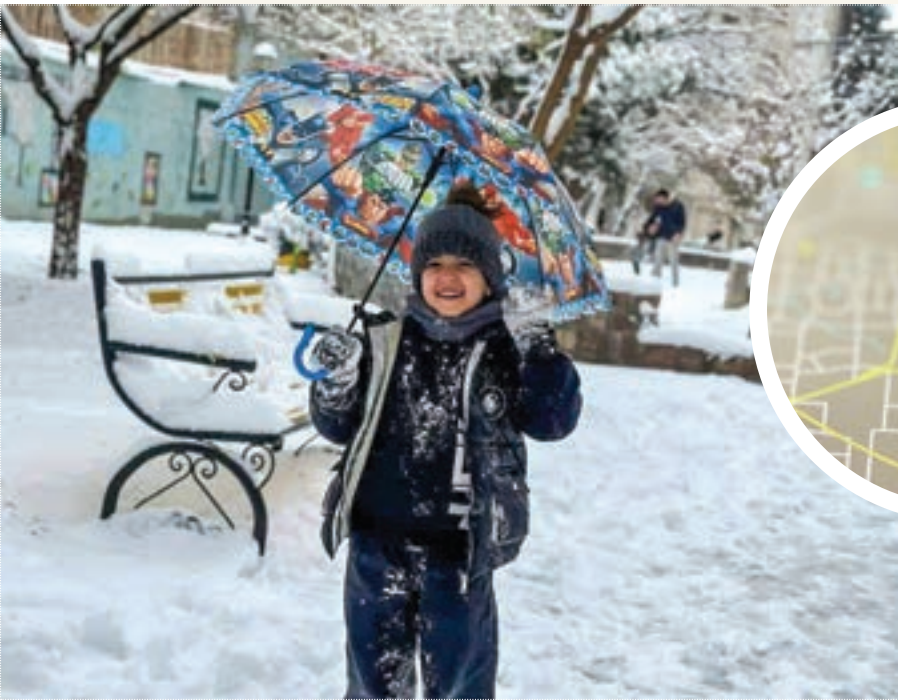
ماکان قاسم زاده، محله شهید بهشتی، منطقه ۸