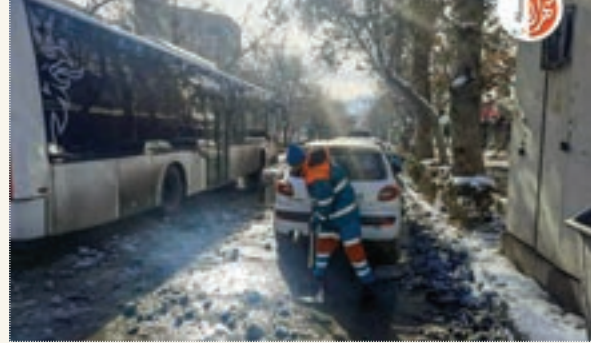
زهرا امجد، محله امام‌رضا(ع)، منطقه ۸