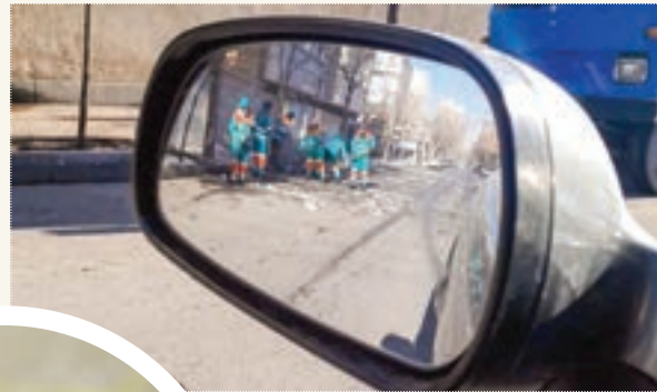
طیبه سرایی، محله امام خمینی(ره)، منطقه ۸