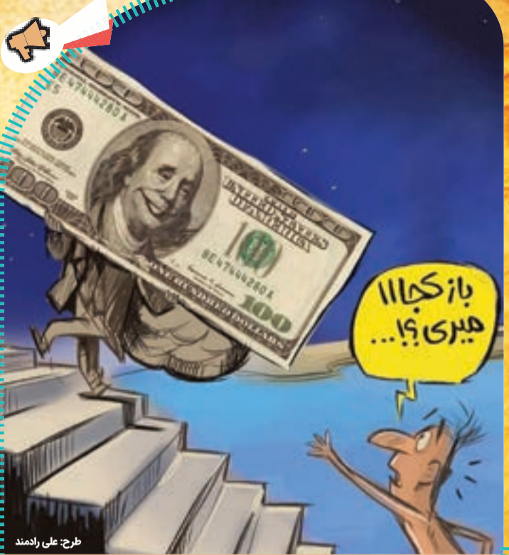
طرح: علی رادمند

بر اساس برنامه‌ریزی مدیریت شهری، «اتوبوس سلامت» در حاشیه شهر فعالیت می‌کند؛ اتوبوسی که رایگان در اختیار خیرین سلامت قرار داده شده است و به دستگاه‌های ماموگرافی و سونوگرافی تجهیز خواهد شد و به‌صورت رایگان در حاشیه شهر خدمات‌رسانی می‌کند.