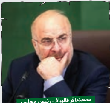
محمدباقر قالیباف، رئیس مجلس

سال نور خدمت همه مردم عزیز ایران تبریک می گویم... ول کن آقا، من دوست ندارم از روی نوشته بخونم. همین طور دلی پیام نوروزی می دم. البته دل و دماغی که برامون نمونه، ولی مردم عزیز، نگران نباشین، برای سال جدید برنامه کارشناسی داریم. اگه دوستان اجازه بدن، آپشن های جدیدی داریم. به کاپشن جدید هم خریدم که به زودی رونمایی می کنم. حالا باز پلخمون می آد کاریکاتورم رو می کشه که دارم کاپشنم رو عوض می کنم. در همین رابطه یه شعر ی هست که می گه... که می گه... نمودنم چی چی حافظا... حالا ولش کنین یاد منی آد. خلاصه سال نوتون مبارک.