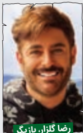
رضا گلزار، بازیگر

سال نومبارک. چیز بیشتری ندارم بگم، تا دو کلمه حرف بزنم، می گن پس چرا فیلترینگ رو بر نمی داری، چرا سرعت نت کمه، چرا اینترنت گرونه... من هم که چیزی ندارم بگم، پس بای!