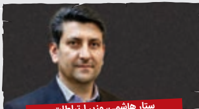
ستار هاشمی، وزیر ارتباطات

سال جدید ر خدمت همه مردم ایران تبریک مُگم. امیدوارم سال جدید دگه تکلیف تعطیلی آخر هفته روشن بره که همه تعطیل مرن یا فقط کارمندای دولت؛ بیره بیشین سر جات، چرا هی ورمخزی وسط صحن رژه مری؟ داشتم مگفتم؛ سعی کنن سال خوبی داشته پشن، ماتیم سعی مکمن با دولت همکاری بیشتری بکنم و وزیرکمتری استیضاح کنیم، ولی قول نمودم! یگ خبرای خوبی هم پری مردم دُرُم که مدُتم اما نمُگم!