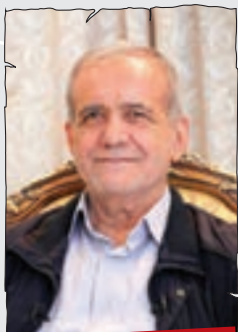
مسعود پزشکیان، رئیس جمهور

سال نور خدمت همه مردم عزیز ایران تبریک می گویم... ول کن آقا، من دوست ندارم از روی نوشته بخونم. همین طور دلی پیام نوروزی می دم. البته دل و دماغی که برامون نمونه، ولی مردم عزیز، نگران نباشین، برای سال جدید برنامه کارشناسی داریم. اگه دوستان اجازه بدن، آپشن های جدیدی داریم. به کاپشن جدید هم خریدم که به زودی رونمایی می کنم. حالا باز پلخمون می آد کاریکاتورم رو می کشه که دارم کاپشنم رو عوض می کنم. در همین رابطه یه شعر ی هست که می گه... که می گه... نمودنم چی چی حافظا... حالا ولش کنین یاد منی آد. خلاصه سال نوتون مبارک.