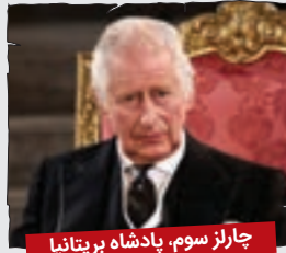
چارلز سوم، پادشاه بریتانیا

ع، سال نو شد؟! من هنوز داشتم ماه رمضان رو تبریک می گفتم و خرما با پودر نارگیل توی ظرف می چیدم. پس با عیال بریم سمنوپزیم، خواننده های پلخمون دعاکنن که چند سال دیگه زنده بمونن تا بتونم از پادشاهی که یک عمر منتظرش بودم، لذت ببرم.