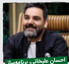
احسان علیخانی، برنامه ساز

من، احسان علیخانی، تهیه کننده، برنامه ساز، مجری و همه کاره، سال نو رو خدمت همه هوادارام تبریک می گم. امیدوارم توی سال جدید باز هم برنامه های بیشتری بسازم که خودم همه کاره شون باشم و بیشتر از قبل دیده بشم تا پلخمون بیشتر از من بنویسه.