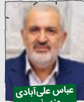
عباس علی آبادی، وزیر نیرو

من هم به نوبه خودم سال نو رو به همه هم وطنان تبریک عرض می کنم. امیدوارم در سال جدید طوری بشه که پلخمون کاری به کار ما نداشته باشه. همچنین امیدوارم در سال جدید یه معجزه ای رخ بده که ناترازی آب و برق و گاز از بین بره. می گم معجزه، چون از دست ما که دیگه کاری به جز دعا برنمی آد!