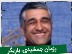
پژمان جمشیدی، بازیگر

سال نو شدس؟ منم سال نو رو تبریک موگم. امیدوارم اون قدر عمرکنم که هر سال رئیس فدراسیون بمونم و هی پلخمون من رو بیارد روی جلدش. بچه به اون گزادست نزن، دکوریه!