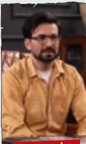
امیر عضد، مجری تلویزیون

نوروز مبارک. یاد به خاطره افتادم... یه بار توی تعطیلات نوروز رفته بودیم بازدید سرویس بهداشتیای بین راهی. پشت در یکی شون نوشته بود آب قطعه، برم همین رو توئیت کنم، شاید توی رئیس جمهور شدنم برای دوره بعد مؤثر باشه!