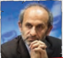
پیمان جبلی، رئیس صداوسیما

سال چه نویی؟ اصلا سال نومعنی نداره. ما باید حال نو رو تبریک بگیم. به امید داشتن حال بهتر در سال جدید، بدون رقیب و شبکه های نمایش خانگی و ماهواره و فضای مجازی و... فقط خودمون باشیم و خودمون. با یه عالمه بودجه های رنگارنگ جدید تا برنامه هایی بسازیم که اشک مردم رو دربیاره... آخ جون!