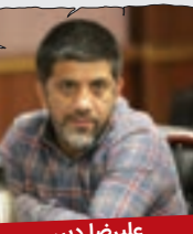
علیرضا دبیر، رئیس فدراسیون کشتی

به جای اینکه سال نو رو تبریک بگیم، باید شبا زودتر بخواهیم تا فرداش بتونیم با انرژی بیشتر در راه خدمت به مدیران، ببخشید، خدمت به مردم کام برداریم. سال نو تبریک نمی خواد، عمل می خواد، عمل بدی! پلخمون، این رو یادداشت کن که ازم نقل قول کنی، ولی از علی دایی و برادران کشتی گیری که اول فامیلشون «خ» داره اصلا چیزی ننویسی ها!