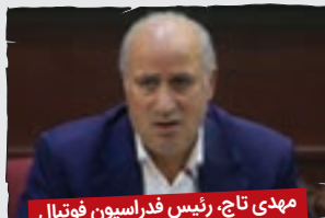
مهدی تاج، رئیس فدراسیون فوتبال

السال النو المبارک. چی؟ سال نو ایرانیه؟ فکر کردم این هم مال کشورای عربیه! دوست دارم یک بار دیگه بیام ایران، به شرطی که مثل قبل اون جور نشه که ترس برم داره و تا یک ماه دچار شب بیداری بشم که مبادا یکی از پنجره هتل بیره تو و خفتم کنه که باهام سلفی بگیره!