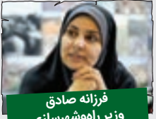
فرزانه صادق، وزیر راه و شهرسازی

سال نو مبارک. سالی پر از سفر براتون آرزو می کنم. چی؟ بلیت هواپیما گرونه؟ خب با قطار برن. گیر نمی آد؟ خب با ماشین شخصی برن. جاده ها خرابن؟ خب بمونن توی خونه و برای ما دعا کنن!