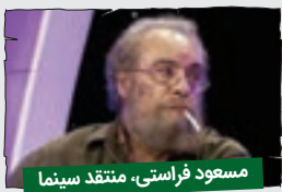
مسعود فراستی، منتقد سینما