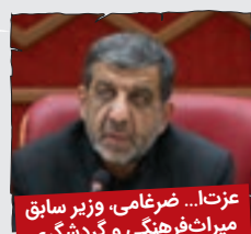
عزت... ضرغامی، وزیر سابق میراث فرهنگی و گردشگری

نوروز مبارک. یاد به خاطره افتادم... یه بار توی تعطیلات نوروز رفته بودیم بازدید سرویس بهداشتیای بین راهی. پشت در یکی شون نوشته بود آب قطعه، برم همین رو توئیت کنم، شاید توی رئیس جمهور شدنم برای دوره بعد مؤثر باشه!