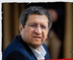
عبدالناصر همتی، وزیر سابق اقتصاد