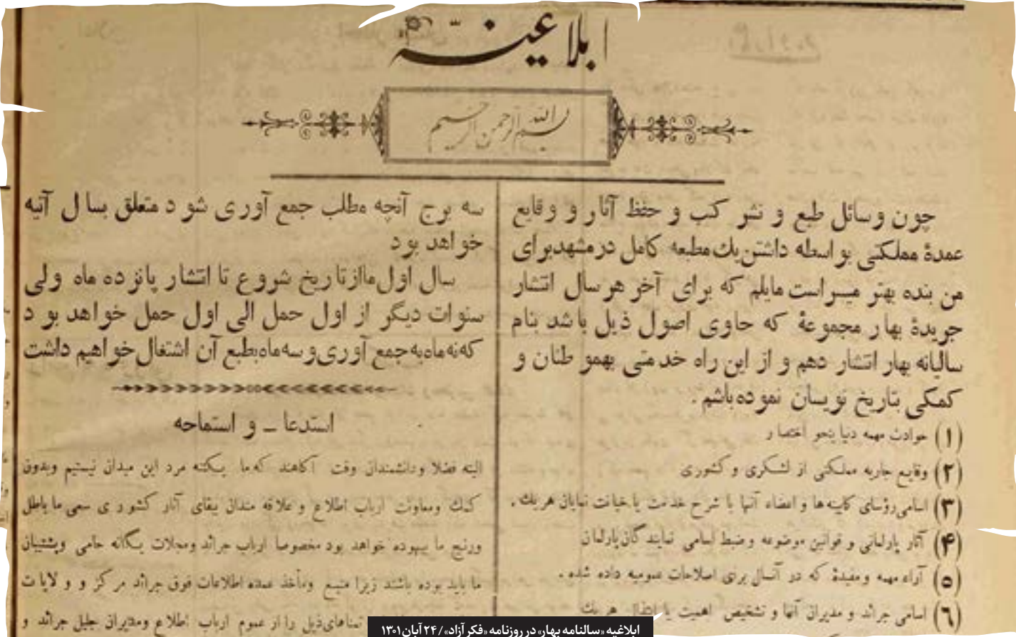
ابلاغیه، سالنامه بهار، در روزنامه، فکر آزاد، ۲۴ آبان ۱۳۱۰

نگاهی به سالنامه های جرابید و چاپخانه های مشهد که ۱۰۰ سال پیش منتشر شدند و مشهد در آن ها پیش گام است