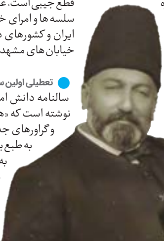
معروف به اعتمادالسلطنه نخستین کسی بود که در ایران یک سالنامه را منتشر کرد