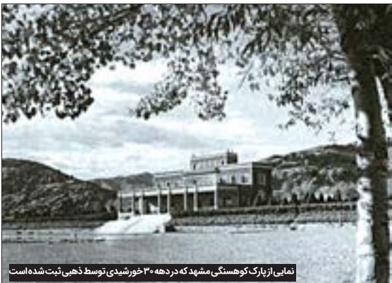
نمایی از پارک هوسنگسی مشهد که در دهه ۳۰ خورشیدی توسط خطی ثبت شده است

بود. همه‌جا حرف از لنین بود و لنینیسم؛ ولادیمیر لنین، رهبر انقلابیون بلشویک که نخستین دولت سوسیالیستی جهان را پایه‌گذاری و به نوعی سرنوشت بسیاری از مردم جهان را تا همین امروز دستخوش تغییر کرد. در این بچوبچه عجیب، روسیه دست‌به‌گریبان بحران بود و بحران‌های سیاسی و اجتماعی هم آمان مردم را بریده بود؛ به ویژه مردمی که نه بلشویک بودند، نه به زبان بلشویک‌ها حرف می‌زدند و همین اختلاف‌ها