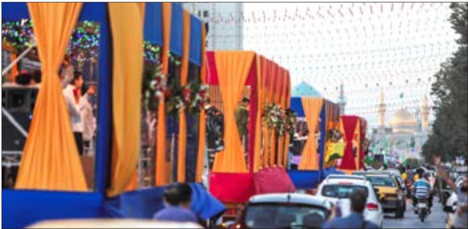
عکس: محمدحسین انصاری

عکس مفاخر به متراژ ۱۲۰ مترمربع رونمایی می شود. کیانی در ادامه با بیان اینکه به مناسبت اعیاد پیش رو تعداد ۱۰۰۰ اویز ستونی به متراژ ۲۰ هزار مترمربع در معابر مختلف شهر مشهد نصب می شود، تصریح کرد: همچنین ۱۰ هزار مترمربع از بنرهای چاپ شده از سوی مناطق، شرکت قطار شهری و دیگر بخش های شهرداری آماده نصب است. وی افزود: در راستای حمایت از تشکل ها و هیئت های مردمی نمایشگاه شمس ولایت نیز با هدف حمایت از ۱۰۰۰ ایستگاه صلواتی در قالب توزیع اقلام پذیرایی، نورافشانی و چاپ بنر راه اندازی خواهد شد.