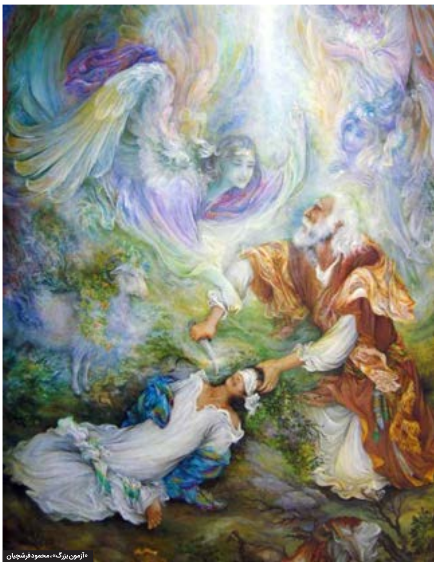
«زمن بزرگ»، مصوود فرشچیان