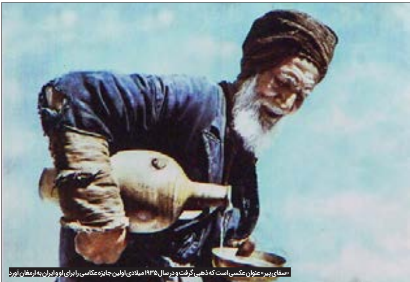
مسئول پیر، عنوان عکسی است که ذهبی گرفت و در سال ۱۹۳۵ میلادی اولین جایزه عکاسی را برای او و برادرش به ارمان آورد

مشهد در سال‌های ابتدایی قرن ۱۴ خورشیدی همواره در حال پوست‌اندازی و تحول و توسعه بوده است. به ویژه بافت پیرامونی حرم مطهر رضوی، هرچه امروز حسرت‌گذشته را بخوریم و یا آه‌واقفوس از بناهای تخریب‌شده اطراف حرم یاد کنیم، چیزی از اهمیت کارهای بزرگ کم نمی‌کند. ماجرای ابداعات