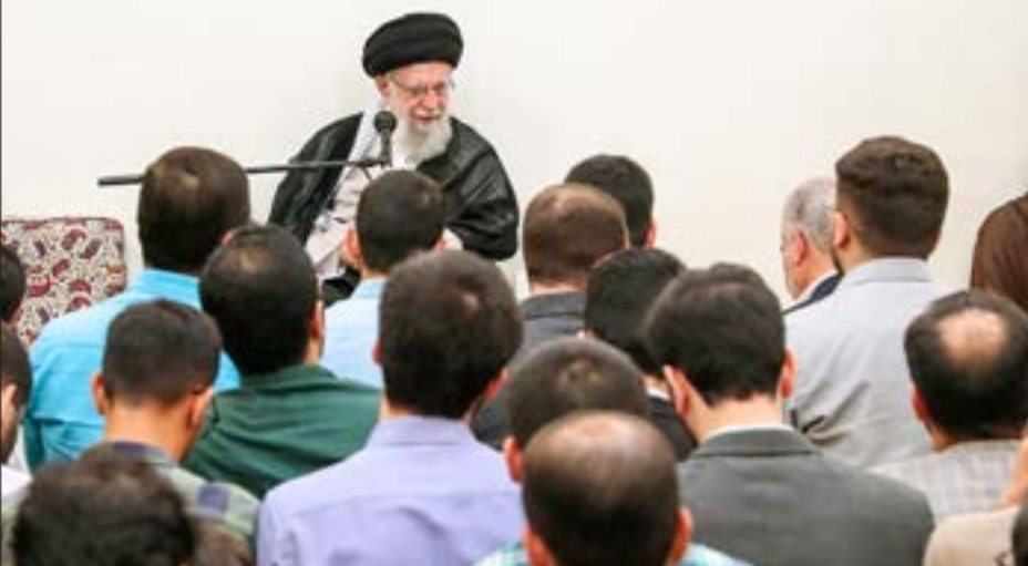
رهبر معظم انقلاب در پیامی به کنگره عظیم و پرشکوه حج، بر ضرورت تقابل با دشمنان اسلام تأکید کردند