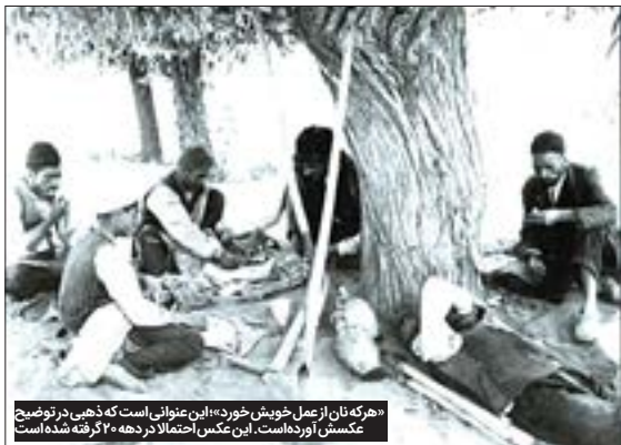
مردگان از محل «دوش خورد» ابن عربی است که ذهبی در توضیح عکسش آورده است. این عکس احتمالاً در دهه ۲۰ گرفته شده است

● پناه بردن به امام‌رضا(ع) از شر بلشویک‌ها