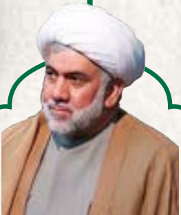
حجت‌الاسلام والمسلمین ریاضت:

قربان عید آن‌هایی است که به معرفت رسیده‌اند؛ زمانی قربان عید خواهد شد که آدمی مسیر قرب را طی کرده باشد و این قرب در گرو خلیفه... شدن است