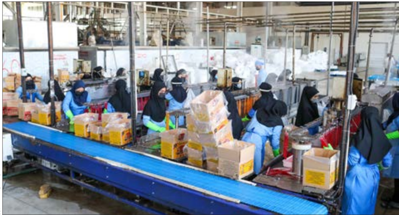
نگین مصححین، مشهد، شهرآر

در نشست تخصصی بررسی الگوی مصرف برق در دادسرای عمومی خراسان رضوی مطرح شد