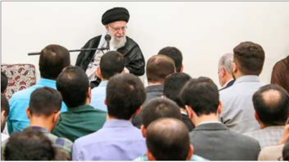
رهبر معظم انقلاب در پیامی به کنگره عظیم و پرشکوه حج، بر ضرورت تقابل با دشمنان اسلام تأکید کردند

دهه ۸۰ و سرعت گیری پیشرفت علمی کشور گفتند: در سال های آخر دهه ۹۰ البته این حرکت قدری افت پیدا کرد؛ البته این افت در دو سه سال اخیر قدری جبران شده، اما نا کافی است و در شرایط کنونی، ما احتیاج به یک خیزش علمی داریم تا به خط مقدم مسائل و مشکلات مختلف فراخوانند و افزودند: مدال آوری یا رتبه بالای کنکور فقط آغاز جریان نخبگی است و باید با خلاقیت فکری و عملی در زمینه های علمی و فناوری و گسترش اخلاقیات، مسیر نخبگی را ادامه داد و به پیش رفت که البته دستگاه های