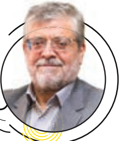
محمد رضا قلندر شریف شهردار مشهد