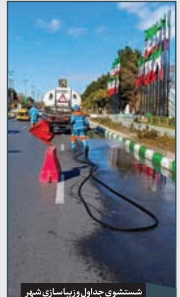
شستشوی جداول و زیباسازی شهر