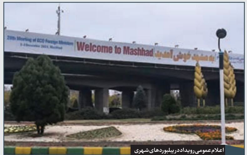
اعلام عمومی رویداد در بیلبردهای شهری