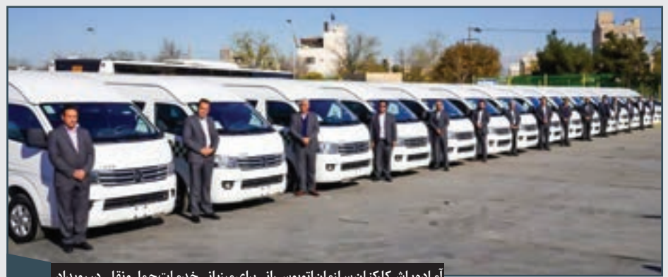
آماده باش کارکنان سازمان اتوبوس رانی برای میزبانی خدمات حمل و نقلی در رویداد