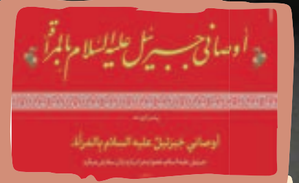
● حدیث نصب شده در محل سخنرانی مورد توجه خیلی‌ها بود.