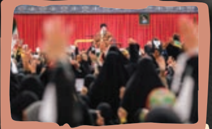
● آیات سوره کوثر در آغاز این دیدار تلاوت شد.