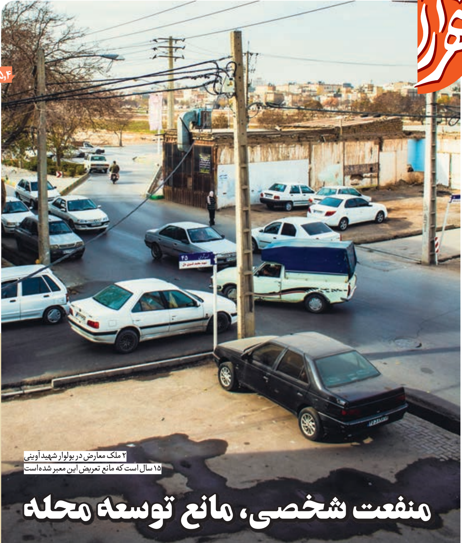
۲ ملک معارض در بولوار شهید آوینی ۱۵ سال است که مانع تعریض این معبر شده است