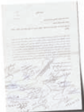
نامه درخواست اهالی مبنی بر تغییر جهت ورودی کوچه

حسن صالحی مفرد می‌گوید: اگر ساکنان خواستار برداشتن تابلو ورود ممنوع یا تغییر محل آن هستند، باید استشهادهای تهیه کنند و پلاک منازل را بنویسند تا مشخص شود که خواسته همگی است و ما پس از این حتماً برای تغییر محل تابلو یا برداشتن آن با سازمان حمل و نقل و ترافیک شهرداری مشهد مکاتبه می‌کنیم.