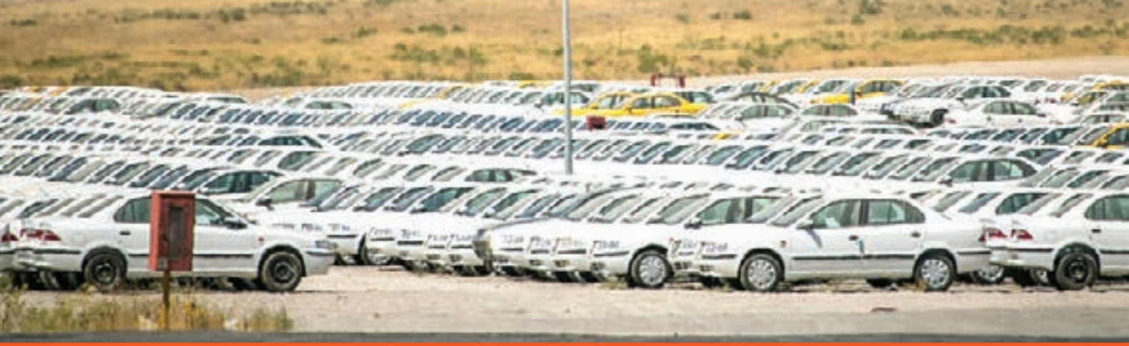
قیمت‌ها به تومان است